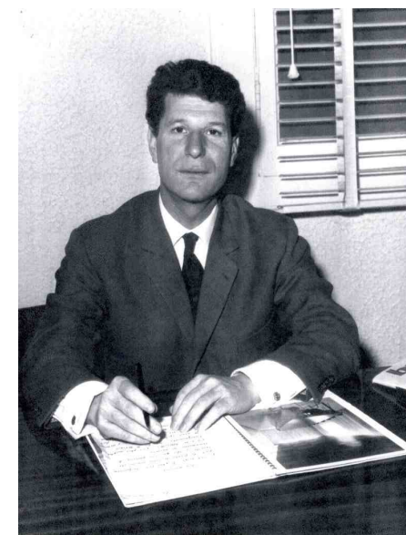
Portrait de Joseph Massota